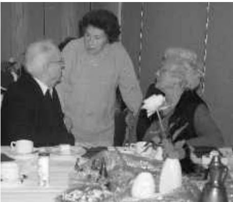
Bekanntschaften wurden bei dieser Gelegenheit erneuert.